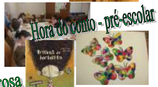
Hora do conto - pré-escolar

Redação e composição: Equipa da Biblioteca EBS Dr. Manuel Ribeiro Ferreira